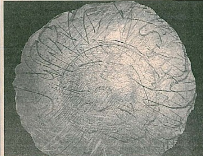
Salim Obralić: Krug, 1997.