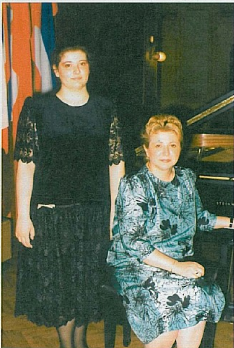
Moja majka je za mene mnoge stvari uradila kao menadžerica, ali je dala "otkaz" na to mjesto