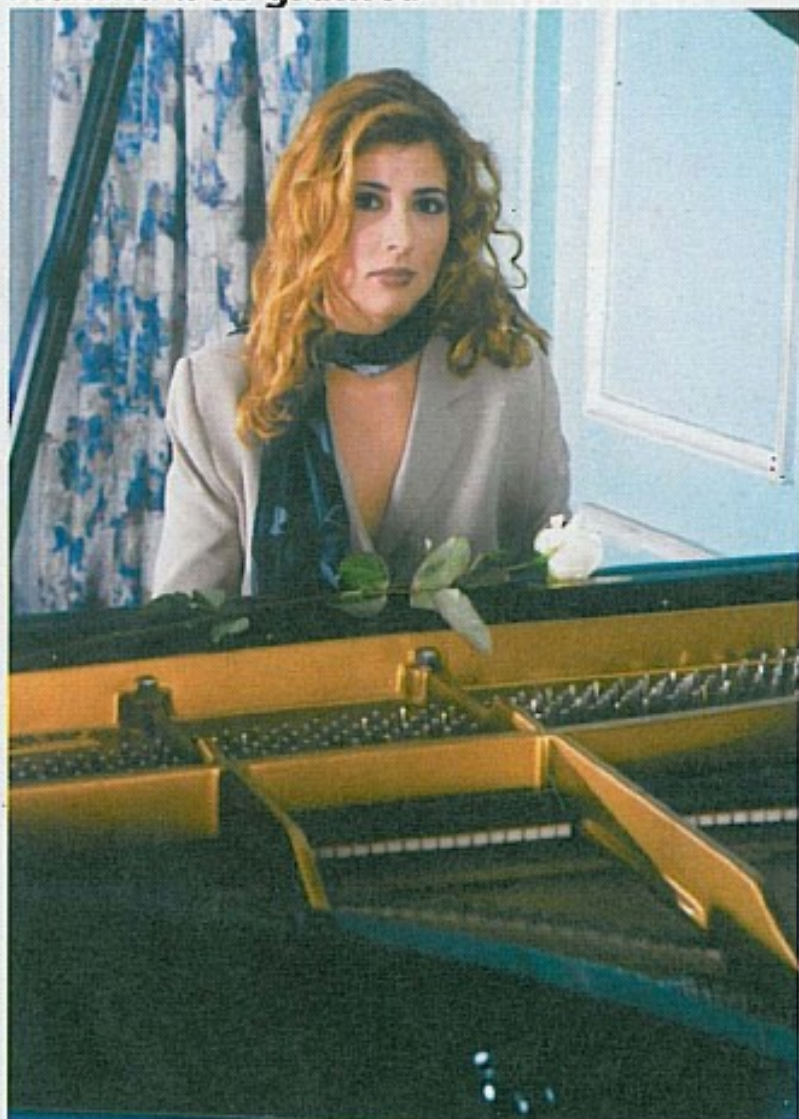
Za značajan doprinos u razvoju muzičke pedagogije, udruženje muzičkih pedagoga FBiH Milici je dodijelilo priznanje